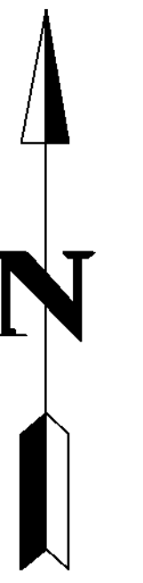
Centre-bourg - Plan B - Echelle: 1/2000